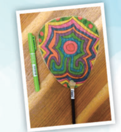
装飾うちわづくり