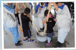
赤米体験教室 (餅つき)