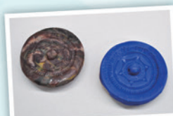
銅鏡マグネット づくり