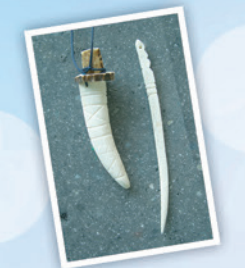
鹿角のアクセサリー づくり