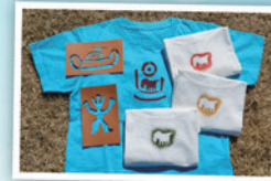
伊勢型紙で装飾文様の 染色体験