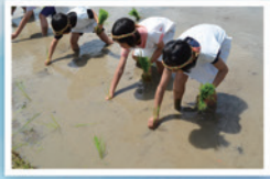
赤米体験教室 (田植え)