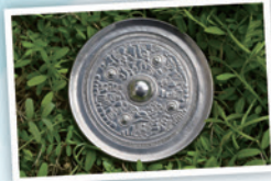
銅鏡づくり (神人車馬画像鏡)