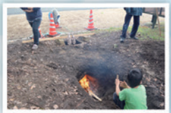
古代のくらし体験