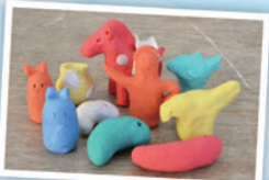
消しゴム粘土を使った 勾玉、埴輪づくり