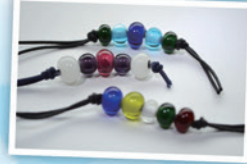
古代ガラス玉づくり