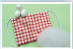
山鹿の繭を使った マスクづくり