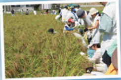
赤米体験教室 (収穫祭)