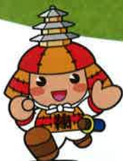
鞠智城イメージキャラクター ころう君

主催 / 山鹿市、山鹿市国営鞠智城歴史公園設置促進期成会、菊池市、菊池市国営鞠智城歴史公園設置促進期成会、和水町、熊本県北広域本部(菊池・玉名・鹿本地域振興局)、熊本県立装飾古墳館、歴史公園鞠智城・温故創生館