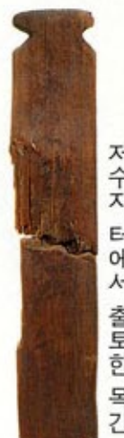
저수지 터에서 출토한 목간