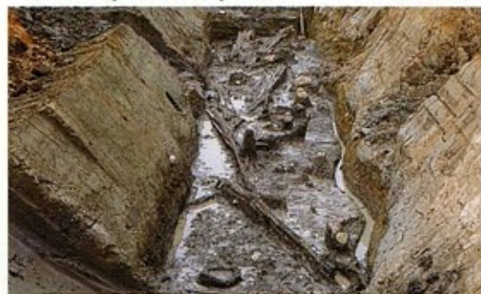
목간이나 건축 자재가 발견된 저수지터

저수지 터는, 조자바루(長者原) 지구 북서부의 골짜기 부근에 있으며, 넓이가 약 5,300㎡입니다. 목간이나 건축 자재 등의 귀중한 유물이 수 많이 발견되었습니다.