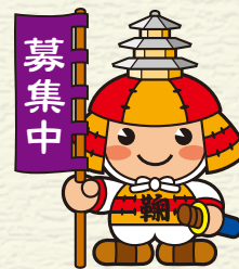
鞠智城イメージキャラクター 「ころろ君」